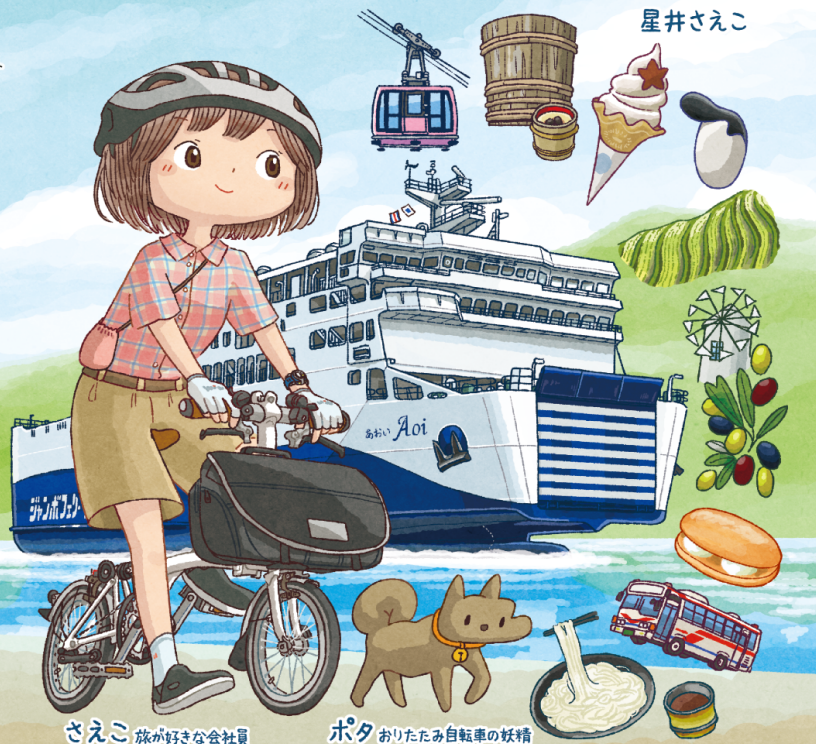
さえこ 故が好きな会社員